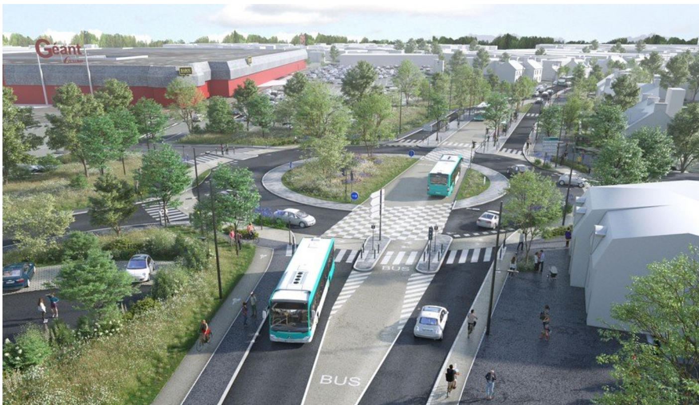
Image de synthèse de l'aménagement du rond-point Pablo Neruda TEO 3 en cours

Le projet TEO (Transport Est-Ouest) est la future ligne de bus qui traversera Saint-Brieuc de Chaptal aux Plaines-Villes, via le centre-ville.