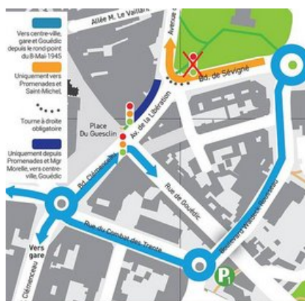
Plan du rond-point du 8 mai 1945

La modification de circulation expérimentée au niveau du rond-point du 8-Mai-1945 s'inscrit dans la logique de cet itinéraire Griffon Futé.