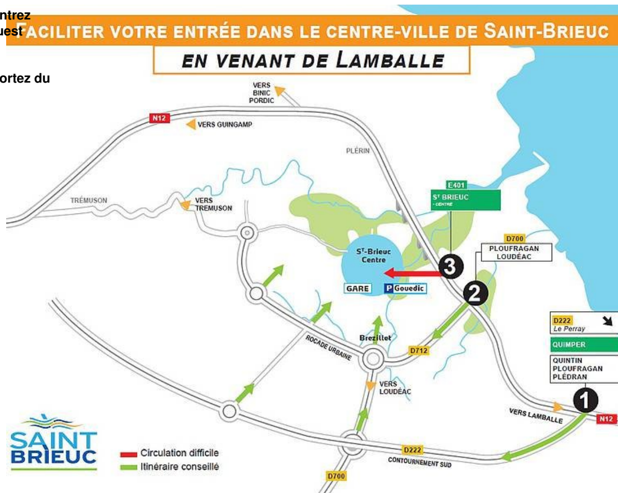
plan pour entrer à Saint-Brieuc côté est