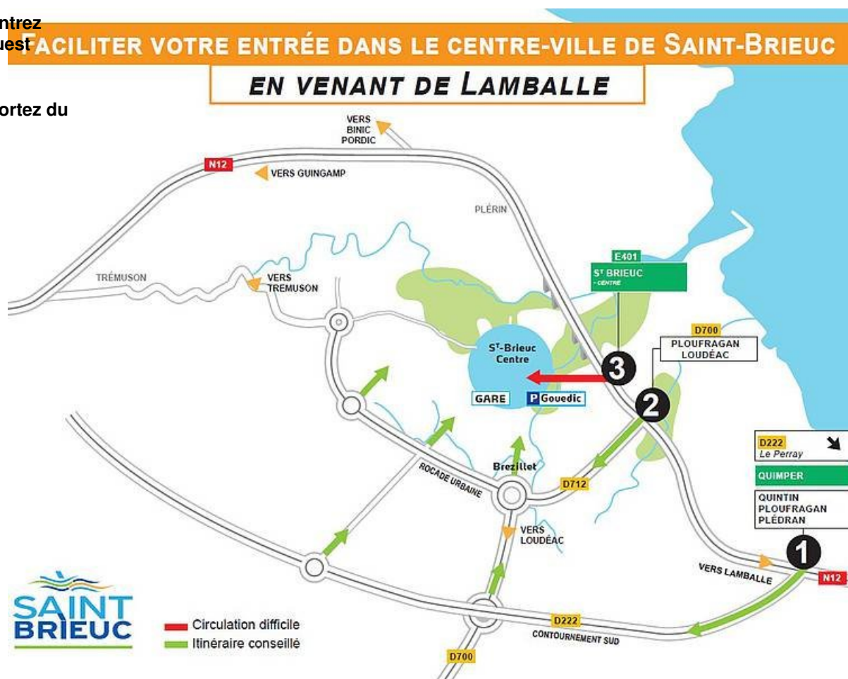
plan pour entrer à Saint-Brieuc côté est