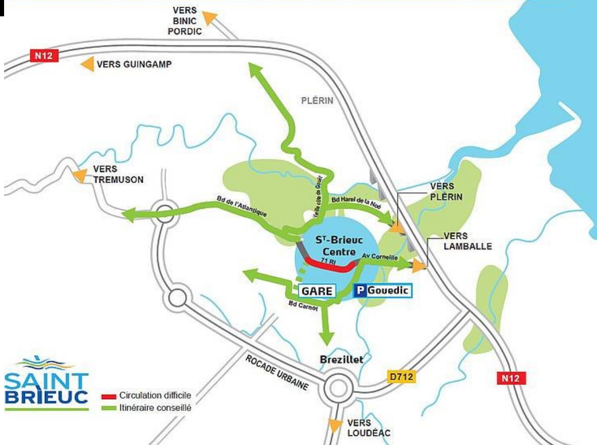
Plan pour sortir du centre-ville