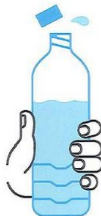
JE BOIS RÉGULIÈREMENT DE L'EAU

En période de canicule, quels sont les bons gestes?